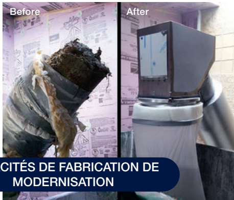
CAPACITÉS DE FABRICATION DE MODERNISATION