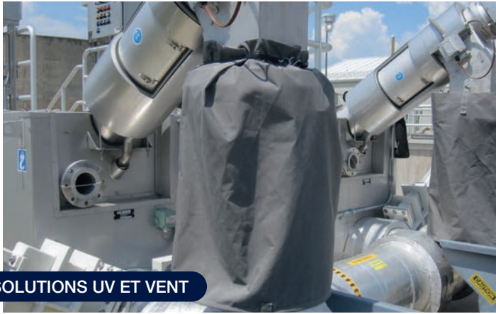
SOLUTIONS UV ET VENT