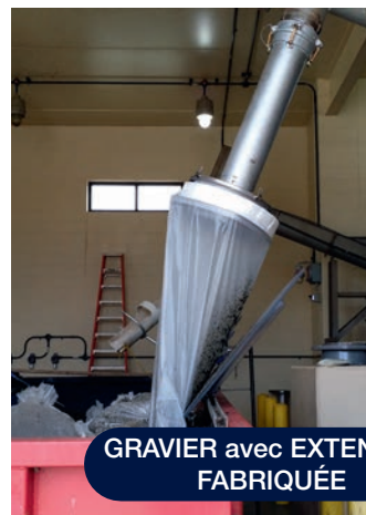
GRAVIER avec EXTENSION FABRIQUÉE

Paxxo propose la fabrication de modernisation de l'évacuation personnalisée pour permettre le montage des adaptateurs Longopac Fill 1H & 2V sur la plupart des tuyaux d'évacuation sur les équipements déjà installés sur site. En outre, nous proposons désormais une solution à double fonction qui assure à la fois la protection contre les rayons UV et le vent. Ce produit contribue à empêcher que le vent n'enlève le sac de la cassette. Il est livré avec le matériel nécessaire pour le fixer sur l'évacuation existante.