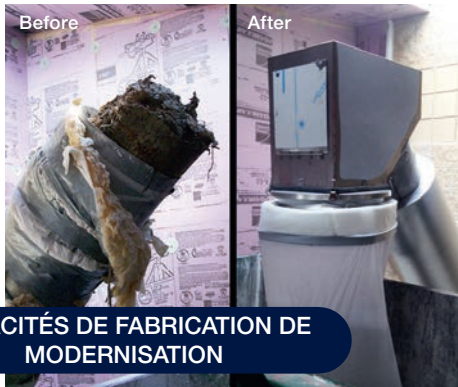
CAPACITÉS DE FABRICATION DE MODERNISATION