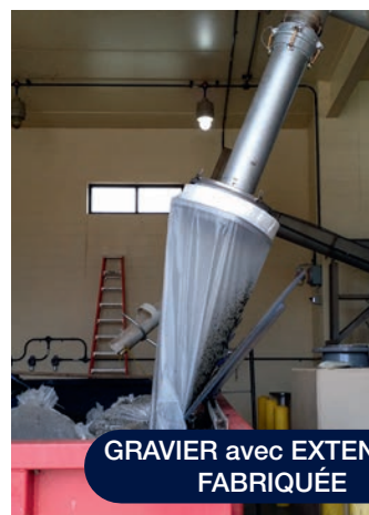
GRAVIER avec EXTENSION FABRIQUÉE

Paxxo propose la fabrication de modernisation de l'évacuation personnalisée pour permettre le montage des adaptateurs Longopac Fill 1H & 2V sur la plupart des tuyaux d'évacuation sur les équipements déjà installés sur site. En outre, nous proposons désormais une solution à double fonction qui assure à la fois la protection contre les rayons UV et le vent. Ce produit contribue à empêcher que le vent n'enlève le sac de la cassette. Il est livré avec le matériel nécessaire pour le fixer sur l'évacuation existante.