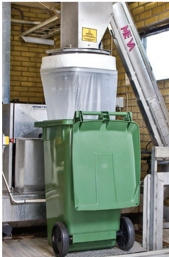
L'unité de traitement de Staffanstorp, en Suède, a installé un Longopac Fill pour le traitement des débris.

La cassette est une gaine continue, en polyéthylène respectueux de l'environnement qui ne produit aucun résidu à la combustion. Chaque sac de cassette mesure 90 m de long.