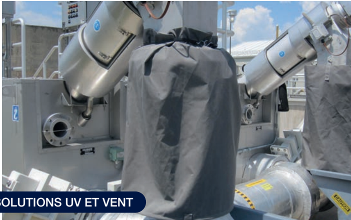
SOLUTIONS UV ET VENT