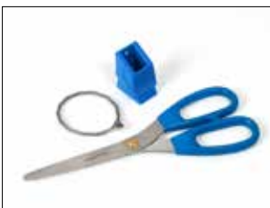
Kit de ciseaux pour Longopac Stand Dynamic, à métal détectable Item no. 34609 Kit contenant des ciseaux à métal détectable, un support de ciseaux et un câble inoxydable.