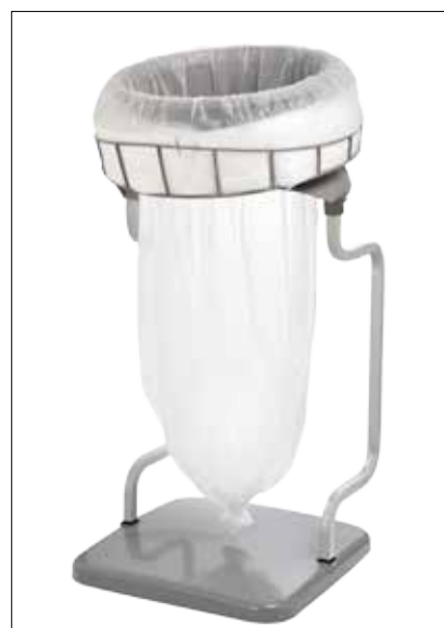
Stand Classic Recycling