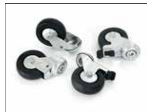
Kit de roulettes, pour Longopac Stand Dynamic, Item no. 34616 Contient quatre roulettes, deux d'entre eux avec des freins. Remplace les roues d'origine sur les stands utilisés dans les zones à accès restreint ESD.