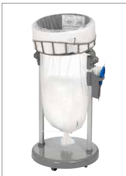
Stand Classic Mini/Mini Food