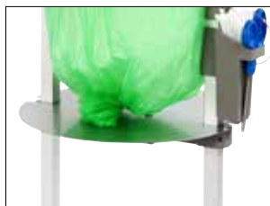
Plaque réglable pour Stand Classic Mini Item no. 31480 Réduit la consommation de matériau de sac ainsi que la taille du sac. Conçue en premier lieu pour les déchets poisseux et lourds. Peut être utilisée avec les cassettes de sacs Bio.