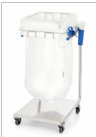
Stand Dynamic Midi/Midi Pedal