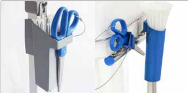
Support d'attaches de câble pour Longopac Stand Classic Standard, gris. N° d'art. 30410 À métal détectable, bleu Item no. 30416 Le support d'attaches de câble permet de remplacer les sacs encore plus rapidement et maintient les attaches en place. Convient à Maxi et Mini et est disponible en deux modèles.