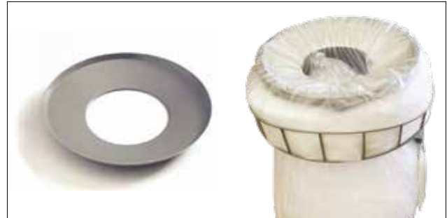
Disque perforé pour Longopac Stand Classic Maxi Item no. 30170 Réduit l'orifice de dépôt, ce qui simplifie la compression du plastique recyclé, par exemple. Uniquement disponible pour Maxi.