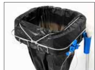
Élastique Item no. 3102 Cet accessoire peut être utilisé pour tous les supports de cassettes Longopac. Verrouille efficacement la cassette et empêche la cassette de se déployer.