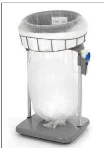
Stand Classic Maxi/Maxi Food