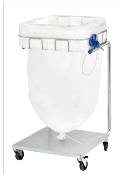
Stand Dynamic Maxi/Maxi Pedal