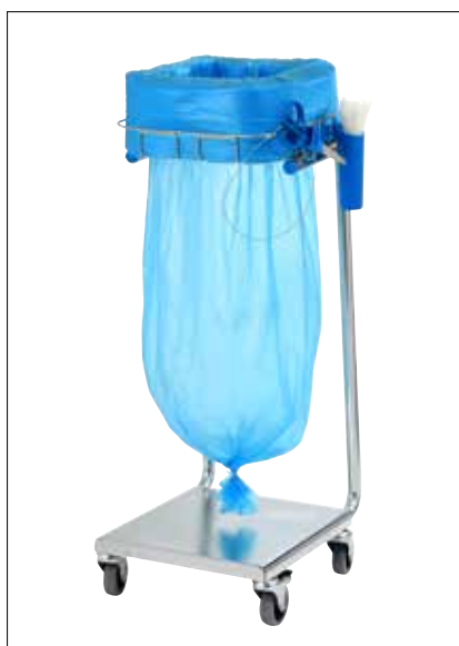
Stand Dynamic Mini/Mini Pedal