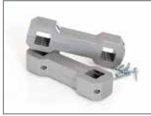
Connecteur de supports pour Longopac Stand Classic Item no. 33750 Pour connecter simplement et solidement deux Longopac Stand ou plus. Il est également possible de connecter Maxi à Mini.